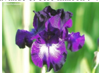
Chiclodenn (iris intermédiaire violet centre blanc) : 6 €