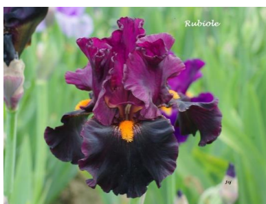
Rubiole (2017) : 10 €

Pétales bleu violacé, sépales blanc laiteux