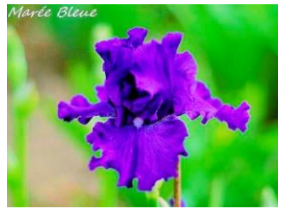
Marée Bleue (Jacob 2012) : bleu moyen uni, nervures plus soutenues, super branchement 7,00 €