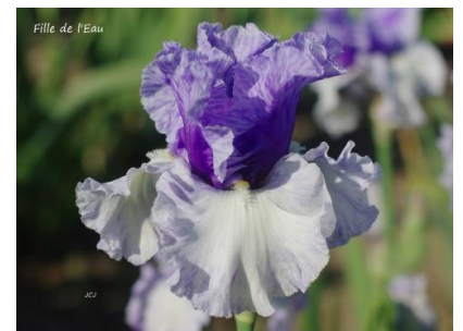
Fille De L'eau (2015) : 7,00 €

Pétales blanc bleuté, sépales bleu violet foncé striés blanc près des barbes orange