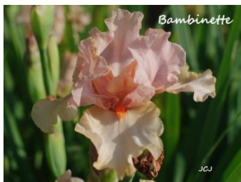
Bambinette (iris intermédiaire rose) : 6 €