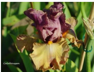
Calaboussen (2014) : 7,00 € Pétales violet clair, sépales ocre