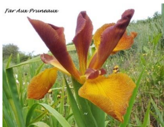
Far Aux Pruneaux (J. C. Jacob Spuria 2021) pétales violet marron, sépales jaune bronze strié marron 10,00 €