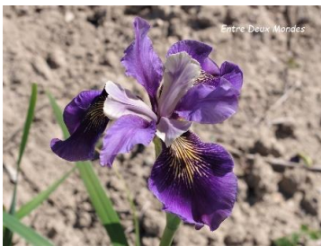
Entre Deux Mondes (J.C. Jacob 2023) cal-sibe 70 cm ; pétales bleu pale, styles bleu violet sépales bleu violet s'éclaircissant à l'extrémité, spot jaune or strié : 15,00 €