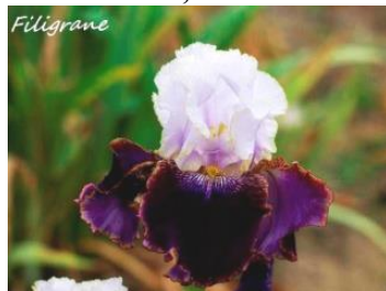
Filigrane (Jacob 2012) Blanc bleuté liseré argent et violet prune liseré ocre barbes bronze 7,00 €