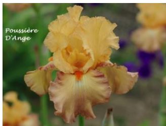
Poussière d'Ange (2014) : 7,00 € Jaune abricot clair allant vers l'ocre marron au bord des sépales