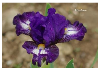
Loulou (Iris nain violet et blanc) : 5 €