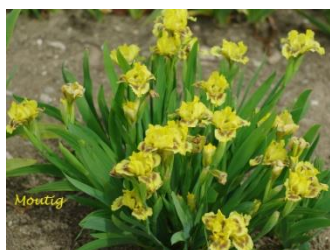
Moutig (iris nain jaune verdâtre spot marron clair) : 5 €