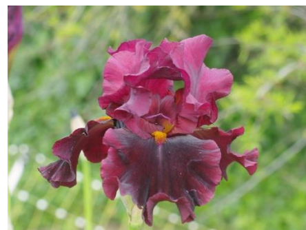
Cassis Groseille (2017) : 9,00 €

Terre de Légende (Jacob 2018, TB), pétales jaune or, sépales orange ocré, barbes jaune. : 10,00 €