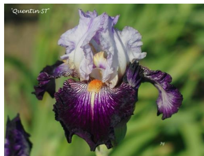
Quentin S.T. (2016) : 7,00 €

Noir, à peine reflets violet foncé aux pétales