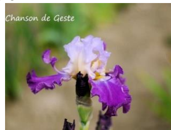
Chanson de Geste (Jacob 2010) blanc infusé ocre et violine, cuillères violine 6,00 €