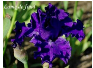
Lame de Fond (Jacob NR) Bleu uni 5,00 €