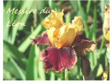
Messire du Léon (Jacob 2012) ; pétales jaune abricot, sépales rouge gratté sur fond or 7,00 €