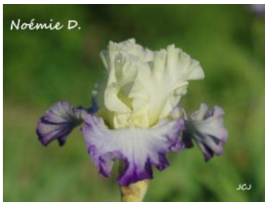
Noémie D. (2015) : 7,00 € Pétales jaune crémeux, sépales bleutés bordés bleu violet moyen