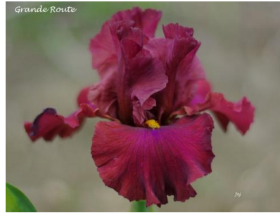
Grande Route (2016) : 9,00 €

Pétales blanc infus jaune, sépales blanc violacé bordé marron