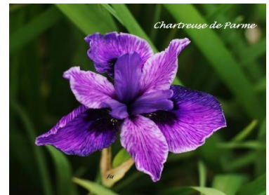
Chartreuse De Parme (J.C. Jacob 2020) Cal-sibe diploïde parme spot noir sur sépales 12,00 €