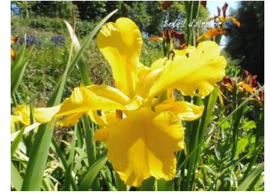
Soleil D'Armor (J.C. Jacob 2021) Spuria jaune vif, bord des sépales ondulés 12,00 €