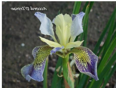
Accord D'Iroise (J.C. Jacob 2021) Cal-sibe tétraploïde pétales bleu pâle, styles crème, sépales bleu striés 12,00 €