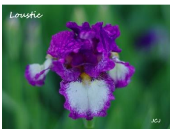
Loustic (iris intermédiaire violet et blanc) : 6 €