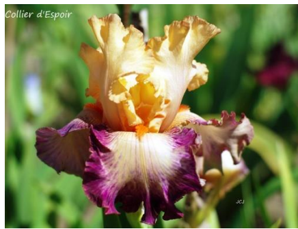
Collier D'Espoir (2016) : 8,00 €

Pétales blanc bleuté, sépales bleu violet strié blanc autour des barbes bronze