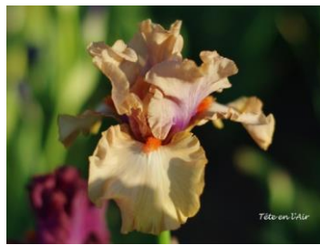
Tête En L'Air (2014) : 7,00 € Pétales beige violacé à la base, sépales beige, barbes orange