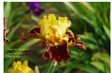
Toul Ar Sarpent (J.C. Jacob 2010) Variegata jaune or et rouge marron, éperons rubis : 6,00 €