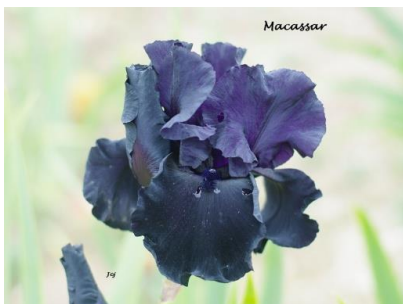
Macassar (2017) : 10,00 €

Pétales jaune ocre, sépales blancs pointillés violine au bord