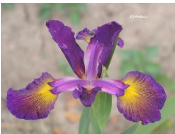
Kersaliou (J.C. Jacob 2023) spuria 80 cm ; pétales violet, styles violet rosé sépales violet, spot jaune bordé marron clair 15,00 €