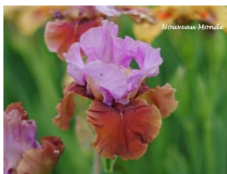
Nouveau Monde (iris de Bordure) Lavande et ocre marron : 7 €