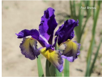
Poul Brohou (J.C. Jacob 2023) spuria 80 cm ; pétales et styles bleu marine, sépales jaune or striés bleu, bords bleu clair 18,00