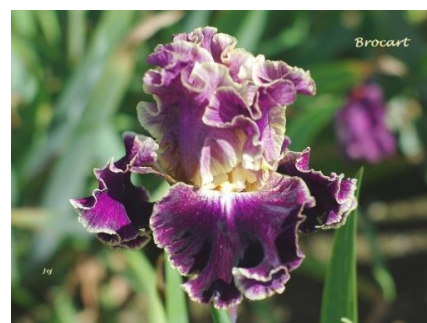
Brocart (2017) : 12 €

Renouveau (Jacob 2018) (TB), pétales jaune clair, sépales jaune clair fortement rayé rouge marron jusqu'à 5mm du bord, barbe jaune or. : 10,00 €