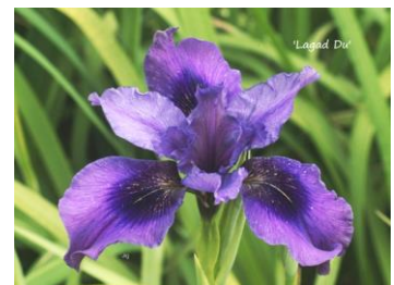
Lagad Du 'J.C. Jacob 2019) Sino -siberian hauteur 60 cm, 2 branches + terminaison, 4 à 5 fleurs. 13,00 €