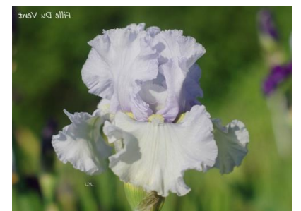
Fille Du Vent (2015) : 7,00 €

Pétales bleu lavande pâle, sépales blanc laiteux