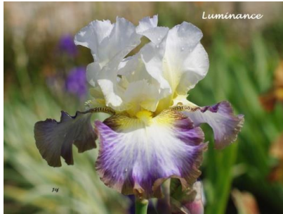
Luminance (2017) : 9,00 €

Pétales blanc infus jaune, sépales blanc violacé bordé marron