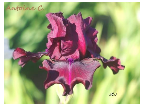
Antoine C. (2015) 8,00 €

Jaune orangé, sépales bordés rose violine