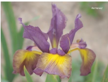
Kernevez (J.C. Jacob 2023) spuria 80cm, pétales violet prune moyen, sépales jaune or bordés violet gris clair : 15,00 €