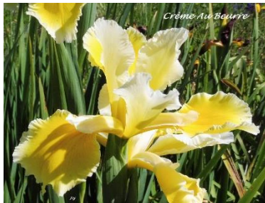
Crème Au Beurre (J.C. Jacob 2021) Spuria pétales crème, sépales jaune clair légèrement bordé crème 10,00 €