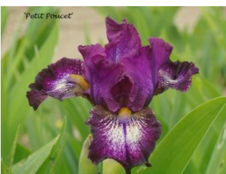
Petit Poucet (Iris intermédiaire violet rosé et crème) : 6 €