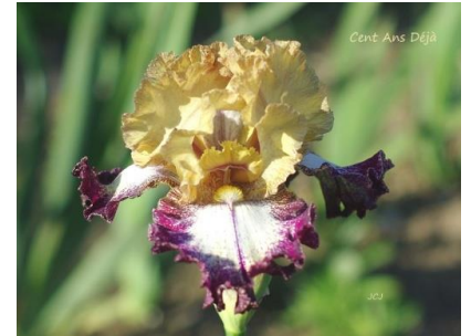
Cent Ans Déjà (2015) :7,00 €

Rose rouge nuancé violet autour des barbes bronze