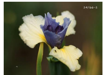
Spadille (J.C. Jacob 2019) hauteur : 80 cm pétales crème plus jaune au cœur, sépales bleu clair 10,00 €