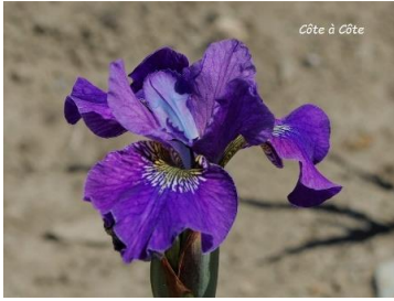
Côte A Côte (J.C. Jacob 2023) 80 cm Iris sibitosa (croisement entre un siberica et un iris sibitosa), violet styles infus de turquoise, bien branché : 15,00 €