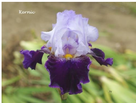
Kernic (2017) : 8,00 €

Pétales blanc bleuté, sépales bleu violet strié blanc autour des barbes bronze