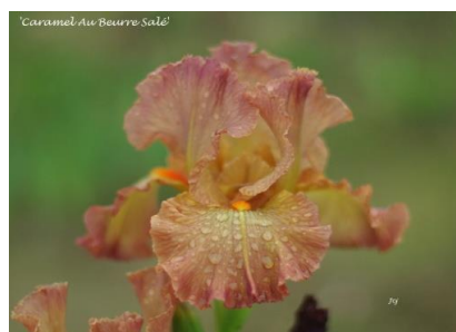
Caramel Au Beurre Salé (2016) : 7,00 € Orange ocré

Pétales grenat, sépales proche du noir, barbe orange très visibles