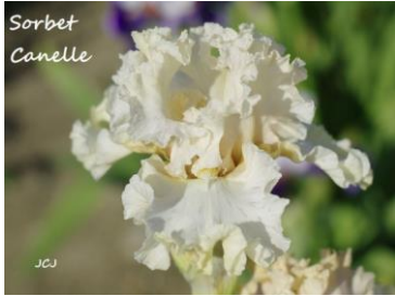
Sorbet Cannelle (2015) : 8,00 € Crème rosé pâle uni, bien ondulé