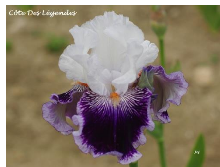
Côte Des Légendes (2017) : 9,00€

Pétales blanc pur, sépales violet bordé très clair stries blanches autour des barbes orange