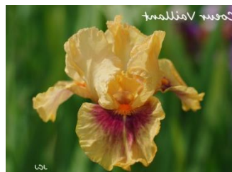
Cœur Vaillant (iris intermédiaire jaune orangé à spot rouge) : 6 €