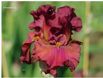
Vincent G. (2015) : 8,00 € Rouge infusé d'ocre à la base, reflets violets, barbes bronze