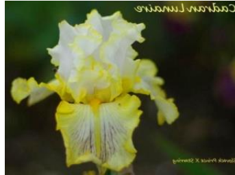
Cadran Lunaire (Jacob 2012), blanc bordé jaune canari, stries violettes aux sépales. 6,00 €