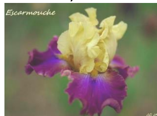
Escarmouche (Jacob 2012) jaune beurre et améthyste à centre bleuté, barbes bronze, éperon violine 7,00 €